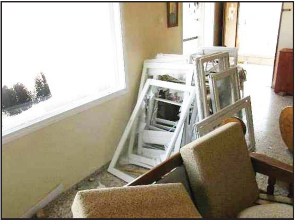
نوافذ بيت أبو علي المحطمة

التجمهر في الملعب. بدأت بإغلاق الشبايبك والباب الرئيسي وعندما اقتربت لإغلاق شباك الصلاة التي تطل على مدخل البيت رأيت الحجارة ترمى باتجاه بيتنا كوابل من المطر، فهربت انا وزوجي للاحتباء من الحجارة الى الغرفة الداخلية وهنا ومن شدة الهلع لم يستطع زوجي الاتصال بأحد مع انه يحمل هاتفين ولم يدر كيف يتصرف. في ذلك الحين اتصلت ابنتي البكر وأخبرتني أن ابنتي الصغيرة موجودة عند الجيران وهي بخير ولكنها أرادت الاطمئنان علينا، فأخبرتها أن اليهود يرموننا بالحجارة ويحيطون ببيتنا ويصرخون «الموت للعرب». وبينما كنت اكلمها وقع زوجي مغمى أرضا بعد شعوره بتسارع دقات قلبه بصورة كبيرة جدا أنعبت جسمه، فطلبت من ابنتي فورا أن تتصل بالإسعاف وأخبرتها بما حصل لأبيها، بعدها عاودت ابنتي